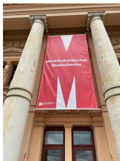
Haupteingang in das Mecklenburgische Staatstheater