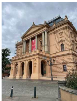
Haupteingang in das Mecklenburgische Staatstheater

Wir haben für Sie einige Fotos aus dem Betrieb / Angebot zusammengestellt. In den Detailberichten finden Sie weitere Fotos.