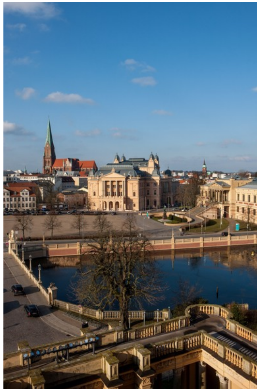
Mecklenburgisches Staatstheater